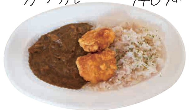
竜田揚げカレー 600 yen