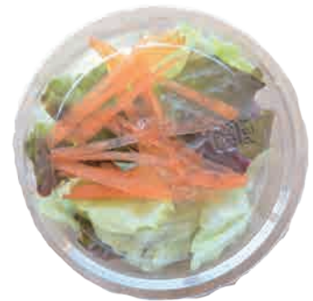
サラダ 50 yen