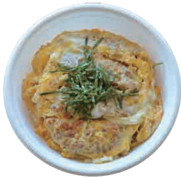
かつ丼 690 yen