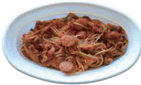
ナポリタン 540 yen