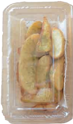
ポテト 190 yen