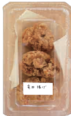
竜田揚げ 240 yen