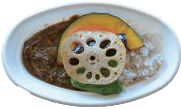
野菜カレー 640 yen