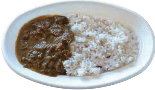
スパイシーカレー 570 yen