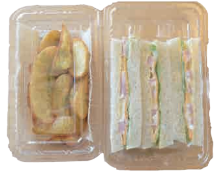
ハムチーズサンド 440 yen