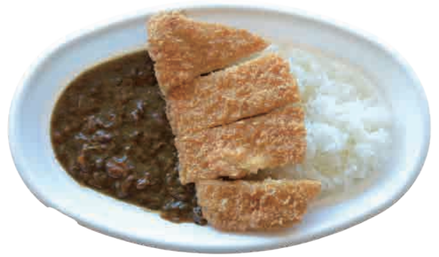
カツカレー 740 yen